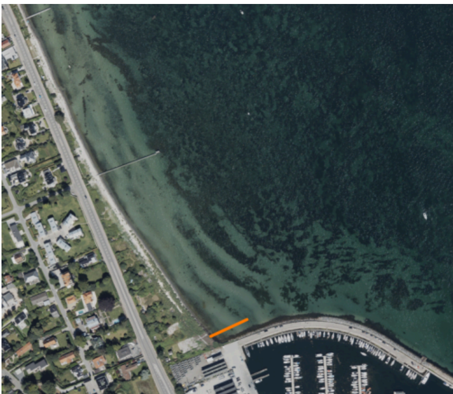
Figur 1. Broens omtrentlige placering markeret med orange på luftfoto.

Administrationen har modtaget en ansøgning vedrører en badebro ud for strandgrunden på Rungsted Strandvej 132 (Bilag 2). Broen er udformet inden for rammerne i kommunens retningslinjer, og ønskes placeret udenfor de nærmeste lokalplanlagte områder. De simple badebroer, som denne og som kommunen er myndighed for, kræver desuden heller ikke en dispensation fra strandbeskyttelseslinjen. Selve broen er placeret udenfor de omkringliggende fredninger, men det kan ikke udelukkes at selve brofæstet på stranden vil kræve en dispensation fra Fredningsnævnet.