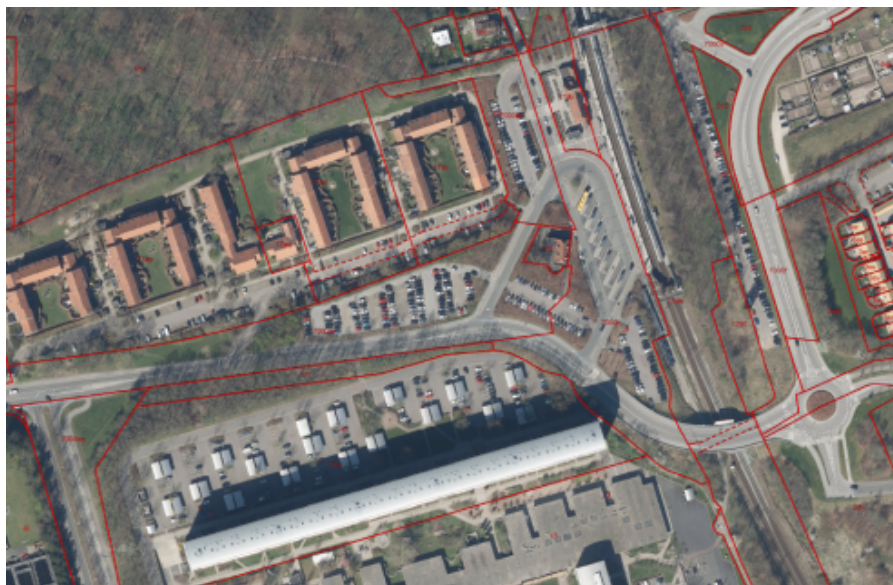
Figur 1.0 En ca. markering af det samlede udviklingsområde omkring Kokkedal St. Området består af en øst- og vestdel, beliggende på hver sin side af stationen.