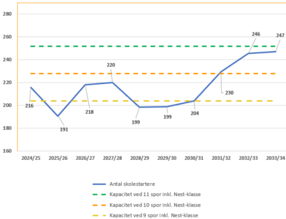
Figur 1: Det forventede antal skolestartere fra skoleåret 2024/2025 til 2033/2034