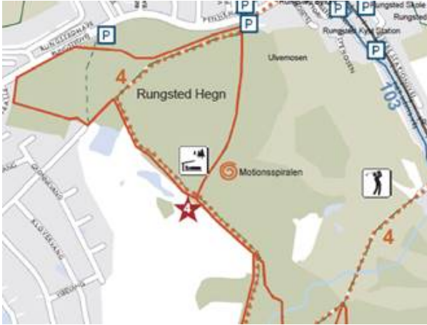
Motionsspiralens lokalisering i Rungsted Hegn.