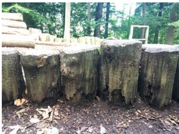
Foto af nedbrudte redskaber, 2017

Hørsholm Kommune etablerede Motionsspiralen i Rungsted Hegn i 2009. Naturstyrelsen lagde som skovejer areal til. Motionsspiralen er blevet driftet og vedligeholdt helt efter planen. I dag er dens levetid imidlertid forbi, da træet er begyndt at blive nedbrudt. Se mere om Motionsspiralen på bilag 1 (informationstavle fra stedet).